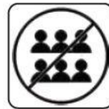
EVITAREA SPAȚIILOR AGLOMERATE