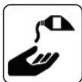
DEZINFECTARE PE MĂINI