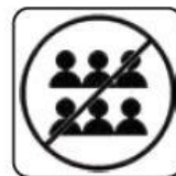
EVITAREA SPAȚIILOR AGLOMERATE