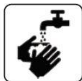
SPĂLARE FRECVENTĂ PE MĂINI CU APĂ ȘI SĂPUN