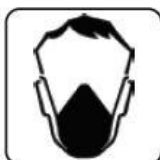
UTILIZAREA MĂȘTII DE PROTECȚIE